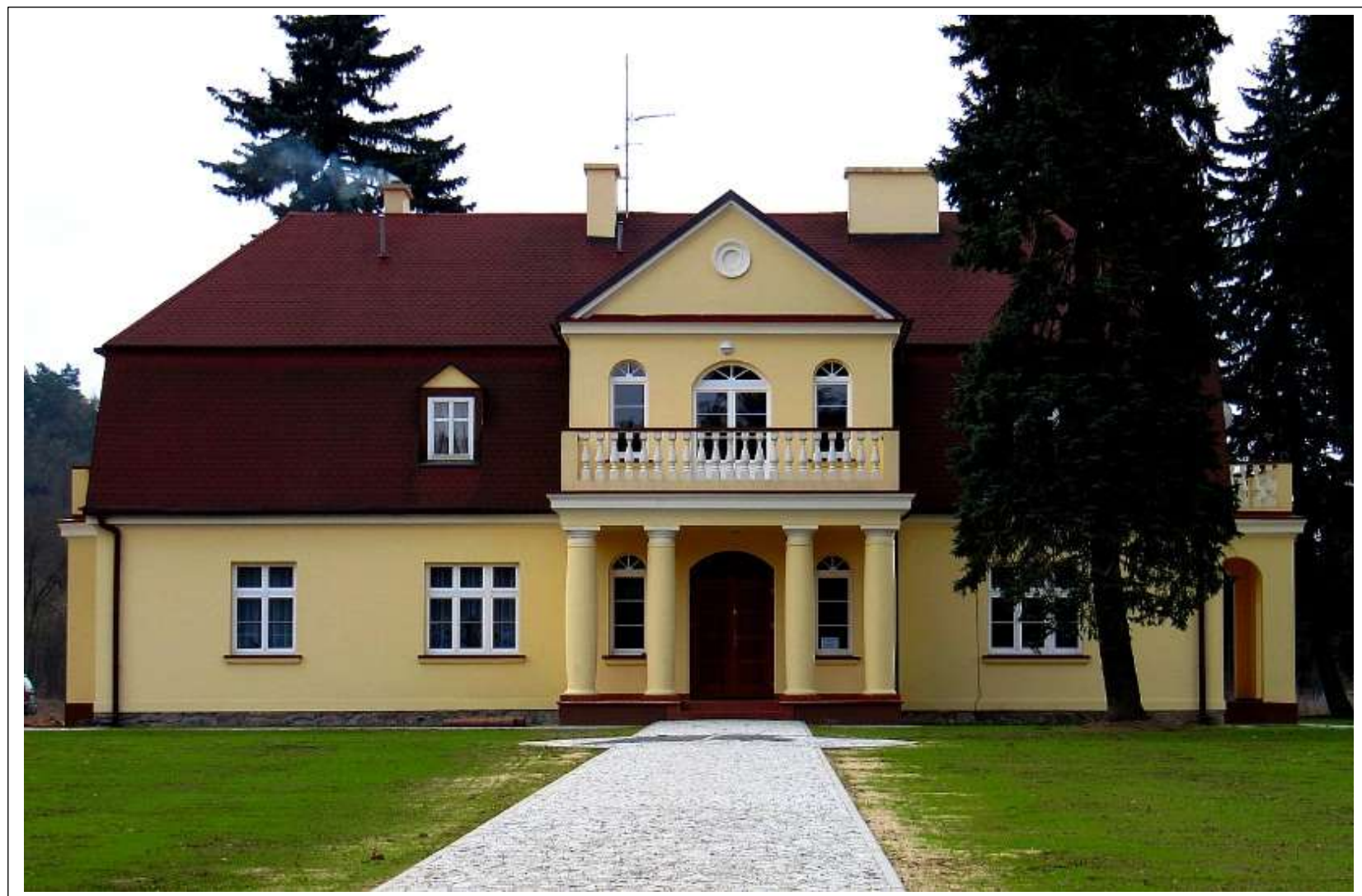
DWÓR W WĄKOLU