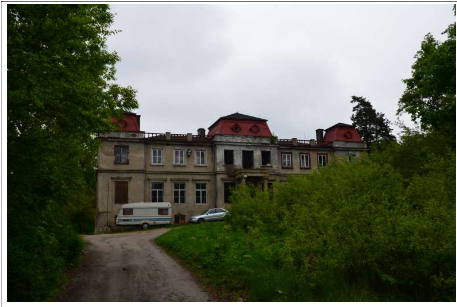
PAŁAC W WIERZBICKU