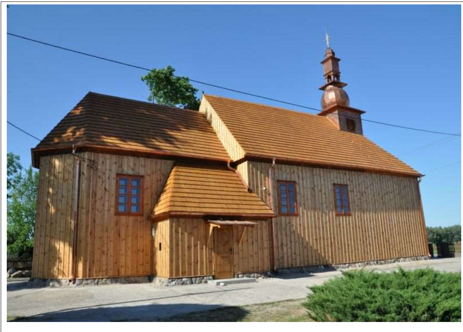
KOŚCIÓŁ PARAFIALNY RZYMSKOKATOLICKI P.W. MATEUSZA AP. W OSTROWITEM