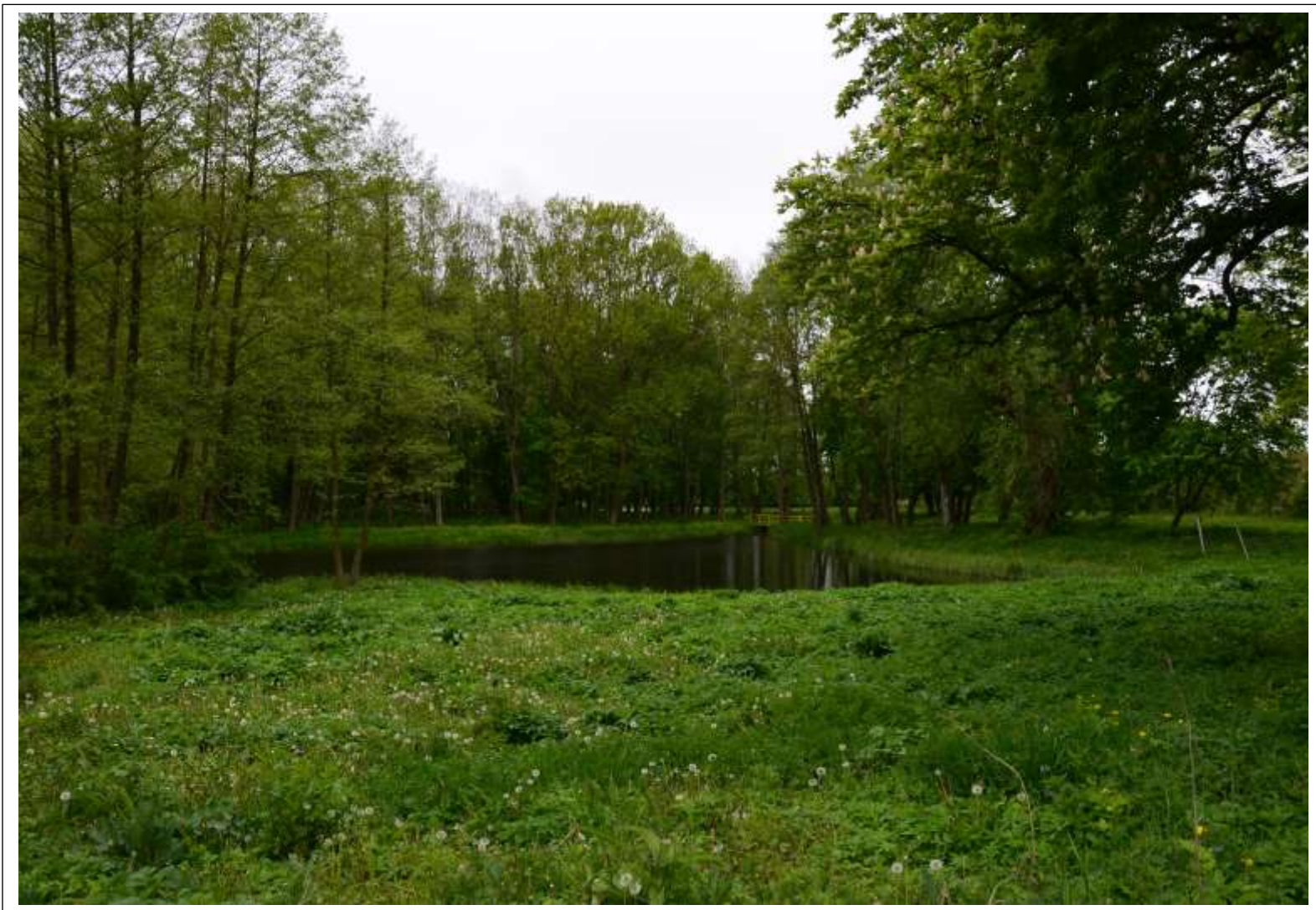
PARK W RADOMICACH