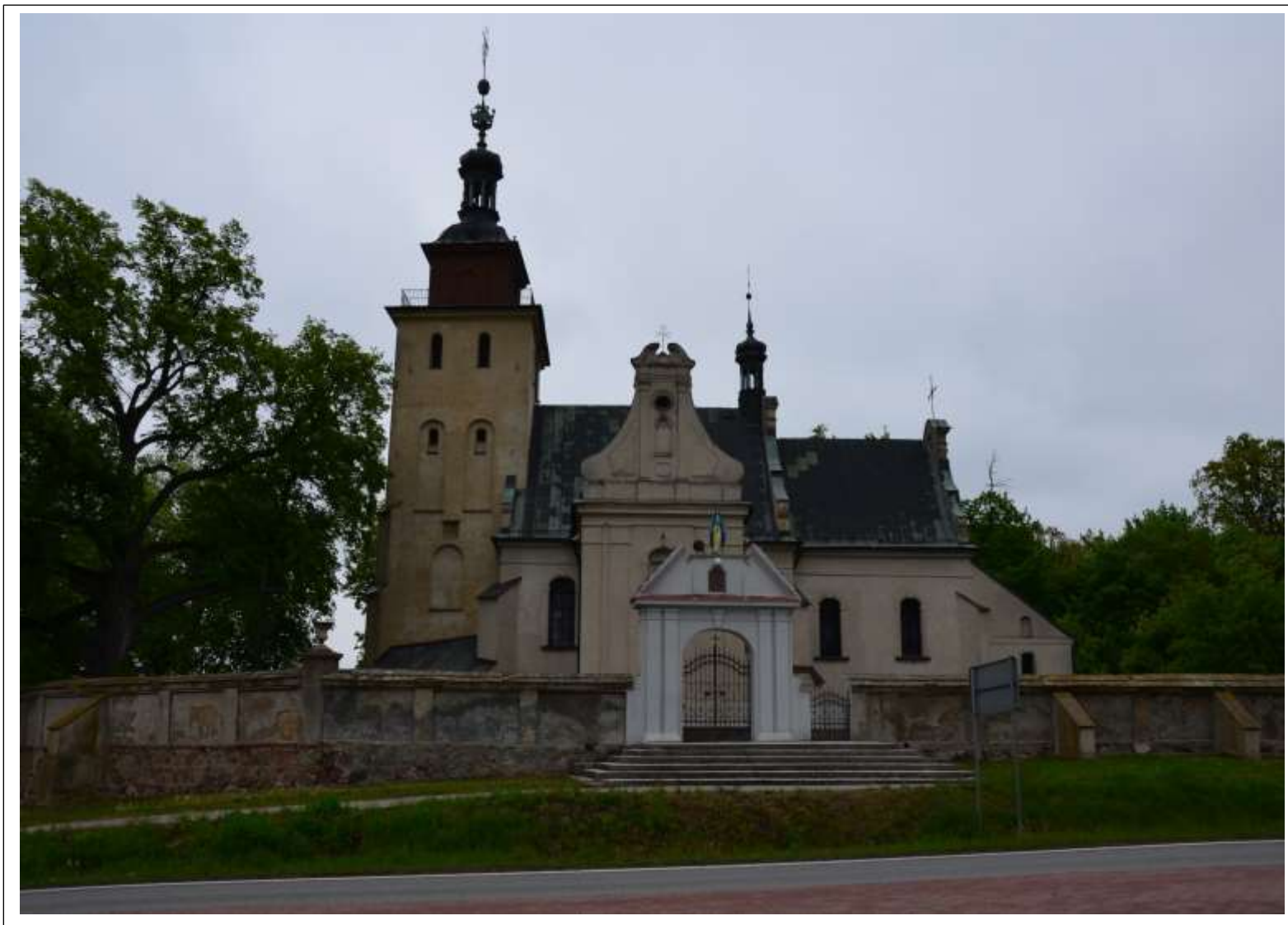
KOŚCIÓŁ PARAFIALNY RZYMSKOKATOLICKI P.W. JADWIGI ŚLĄSKIEJ W KARNKOWIE