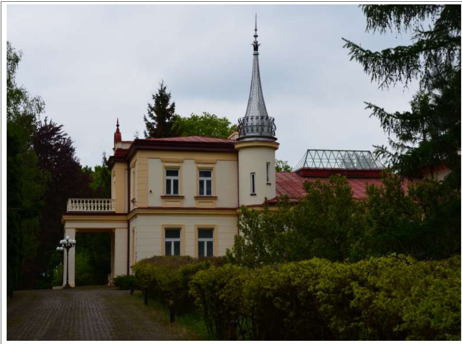
DWÓR W GŁODOWIE