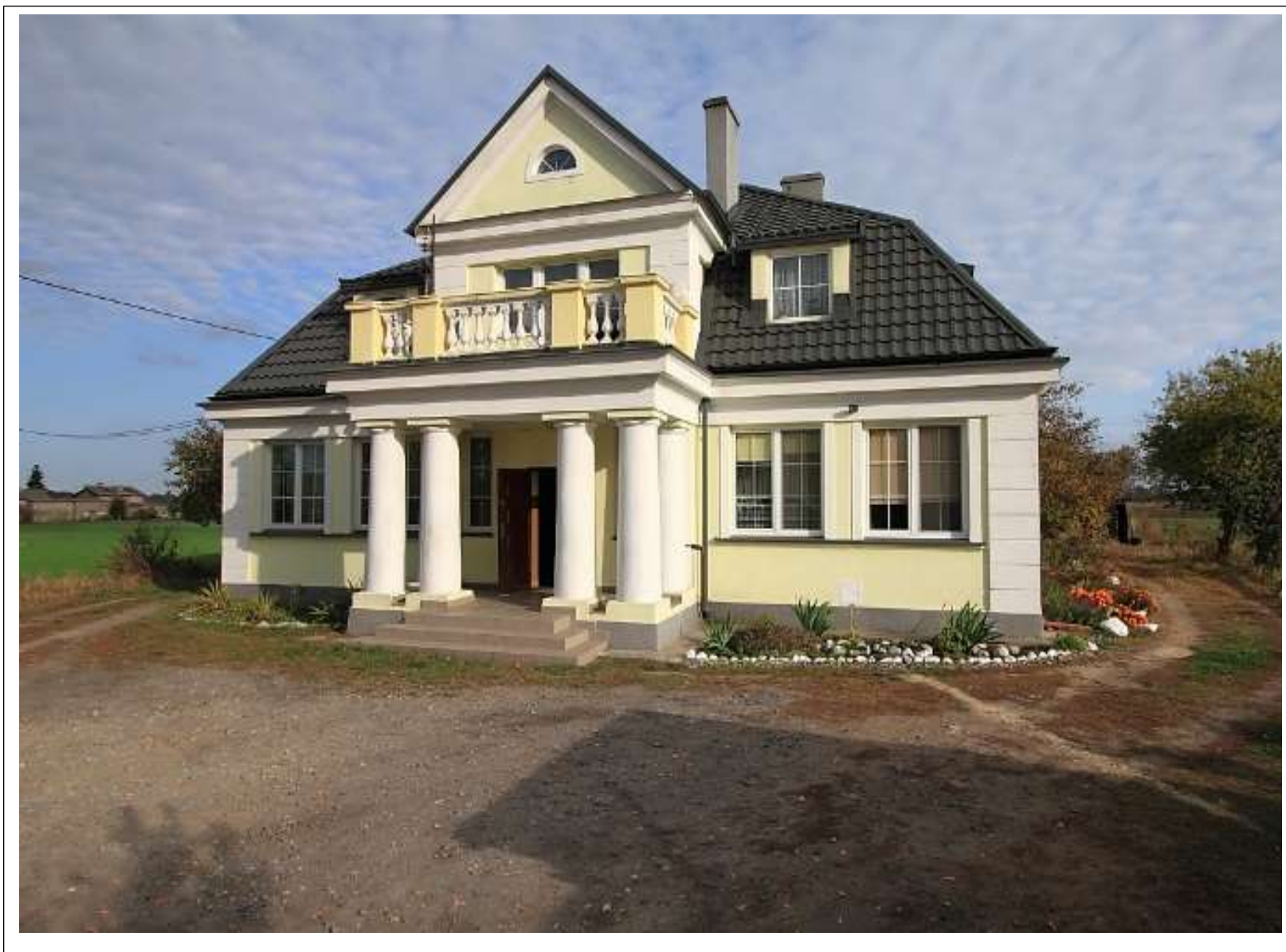
DWÓR W CHLEBOWIE