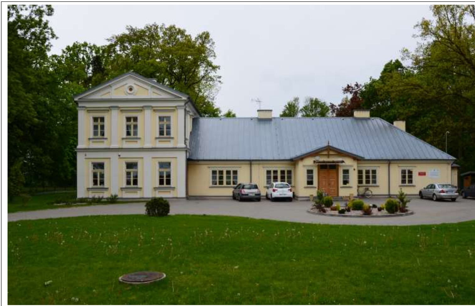
DWÓR W JASTRZĘBIU