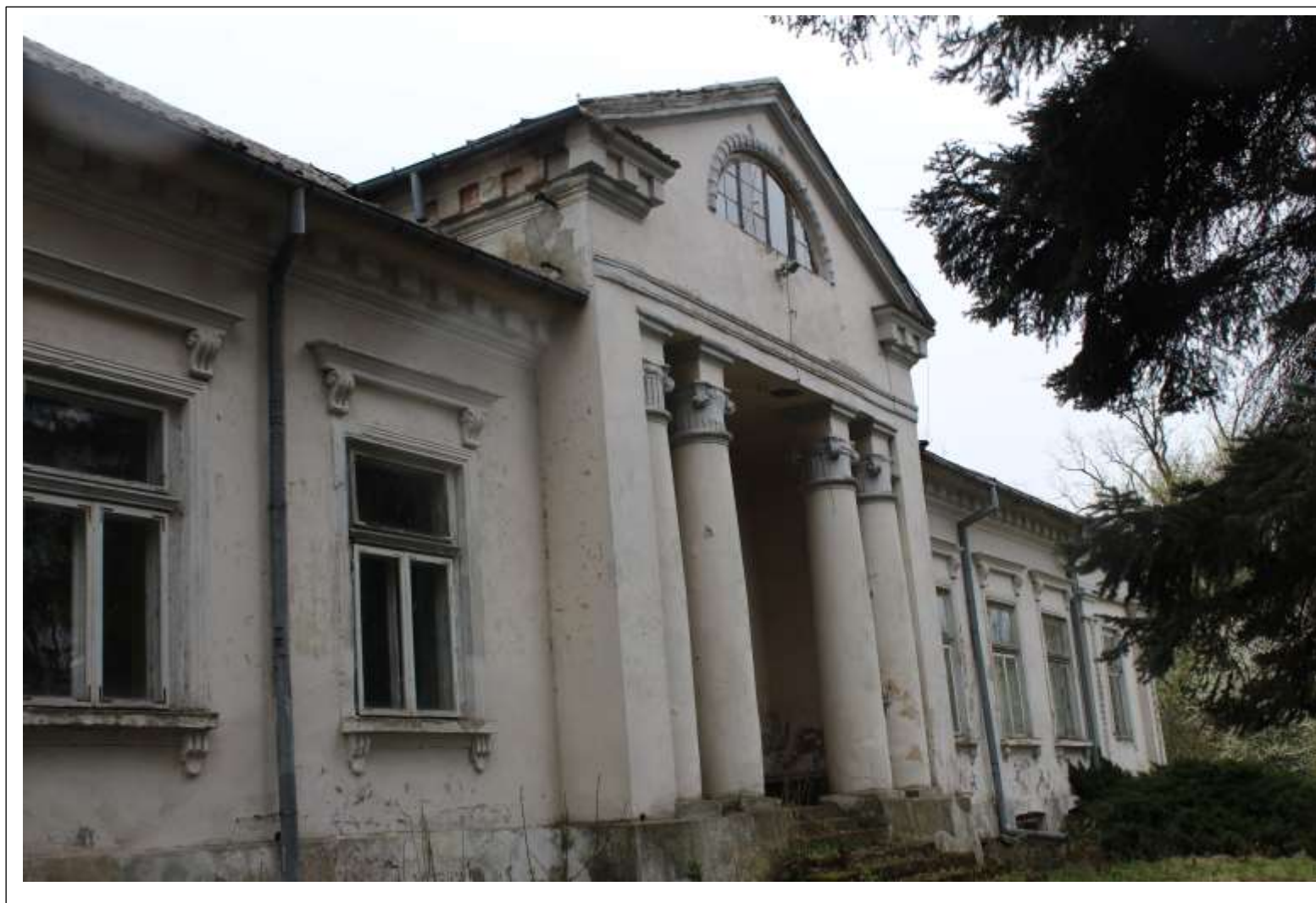
DWÓR W KARNKOWIE