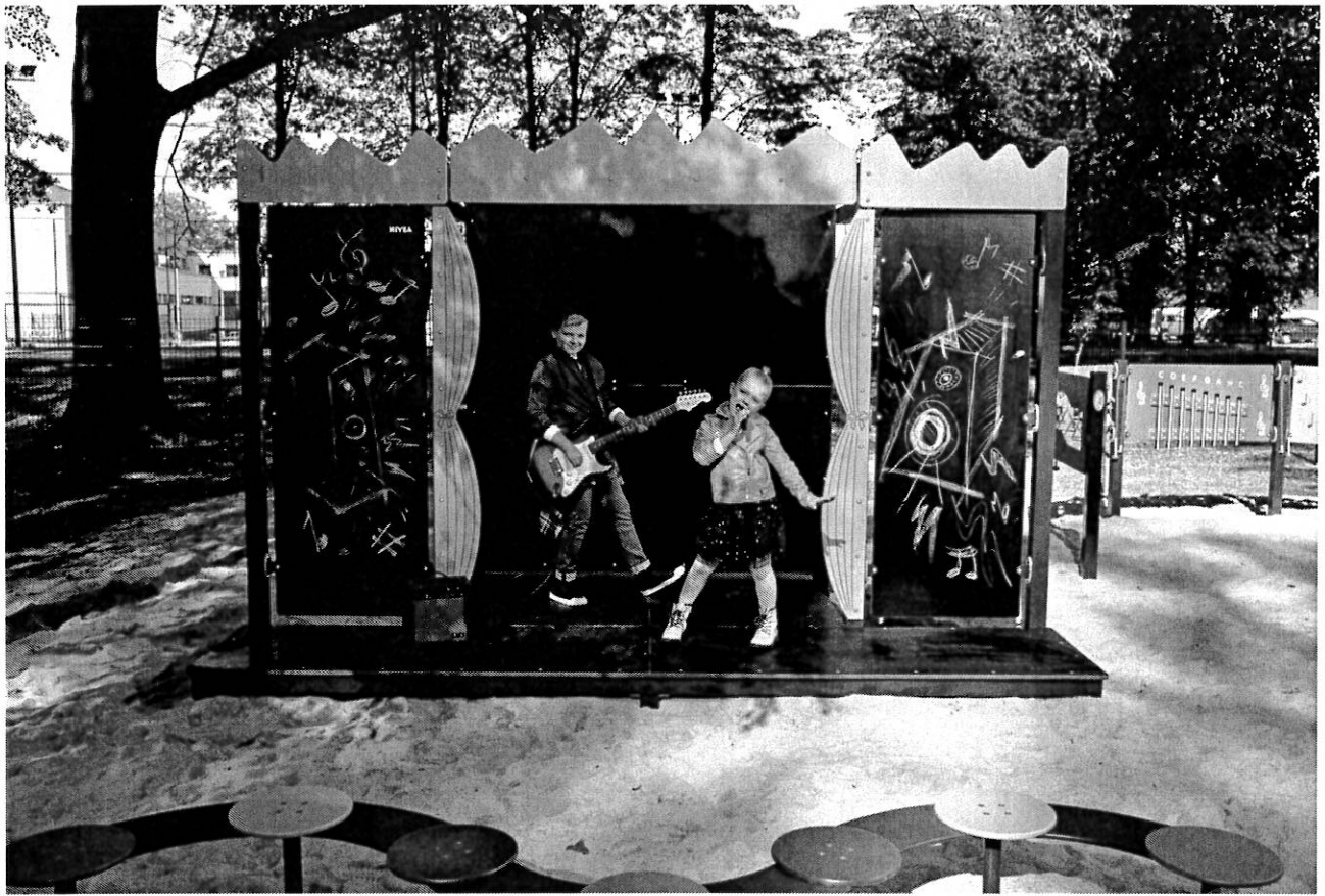
— NIVEA PLAC ZABAW1346.jpg —