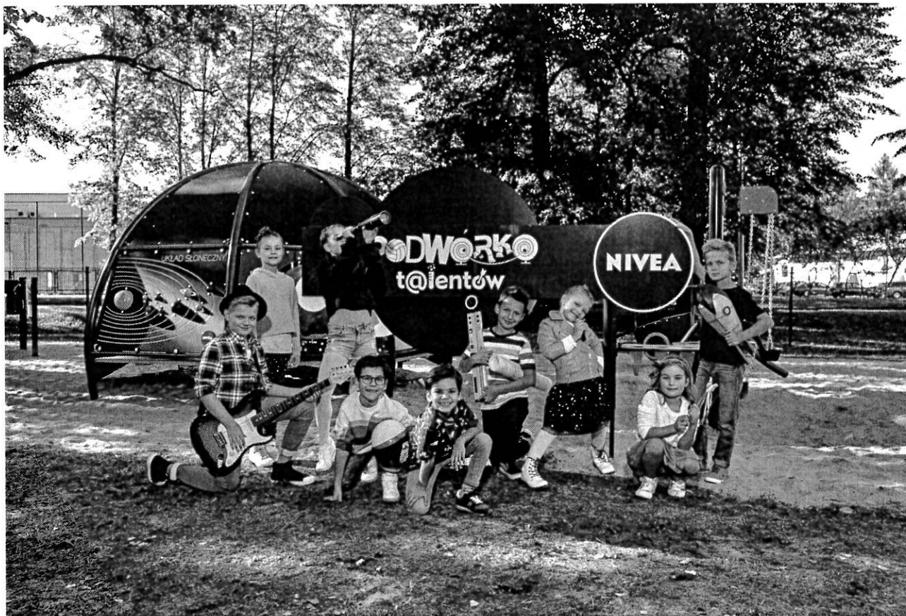
— NIVEA PLAC ZABAW0639.jpg —