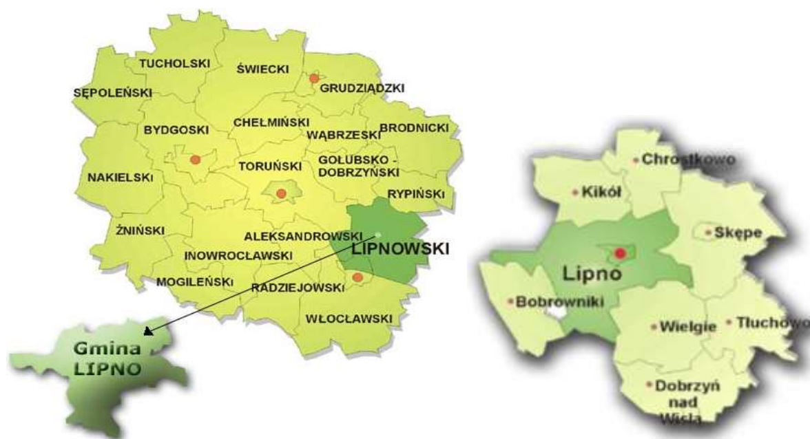
Rysunek 1. Położenie Gminy Lipno na tle województwa kujawsko – pomorskiego oraz powiatu lipnowskiego.