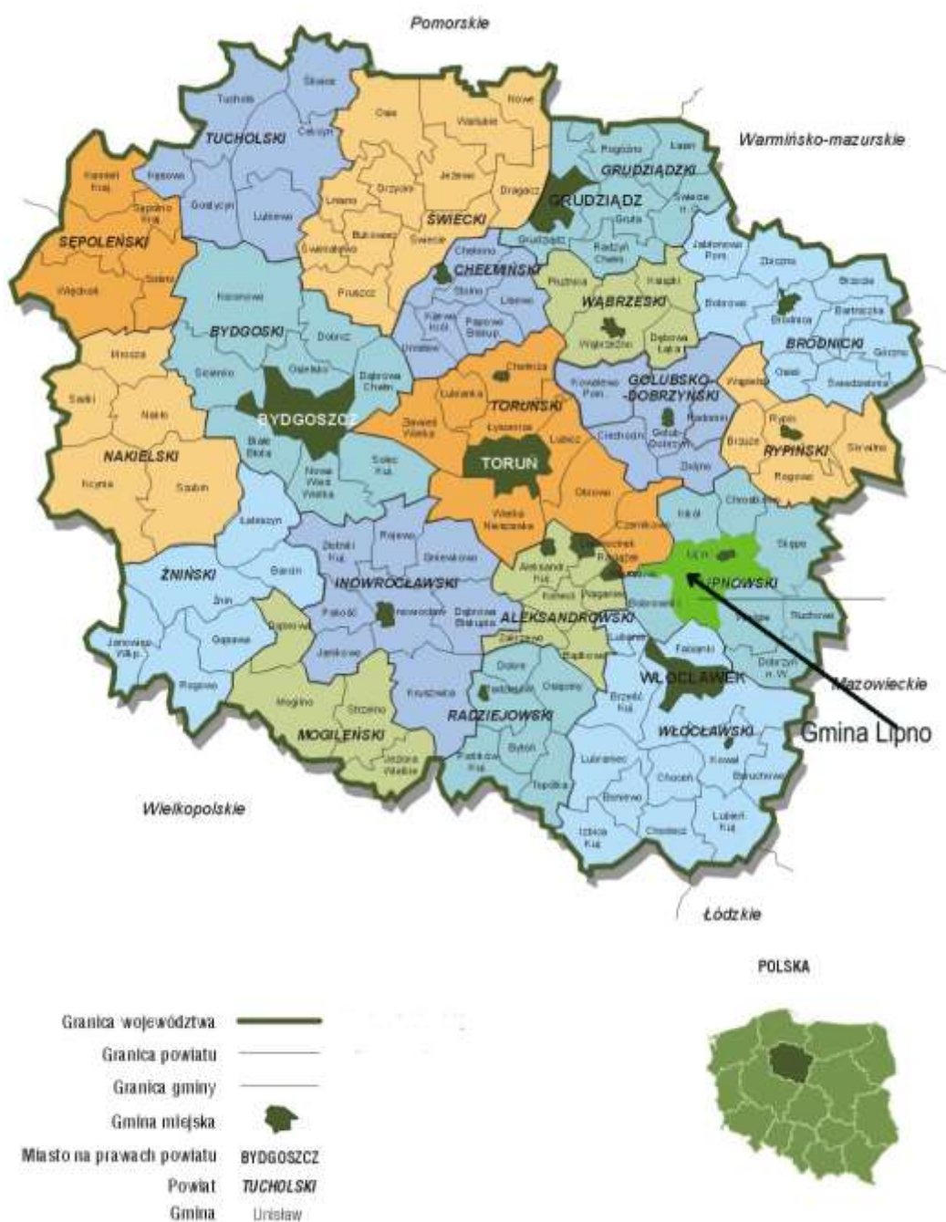
Rysunek 1. Lokalizacja Gminy Lipno na tle województwa kujawsko-pomorskiego