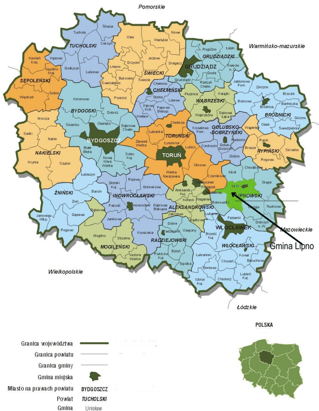
Rysunek 1. Lokalizacja Gminy Lipno na tle województwa kujawsko-pomorskiego