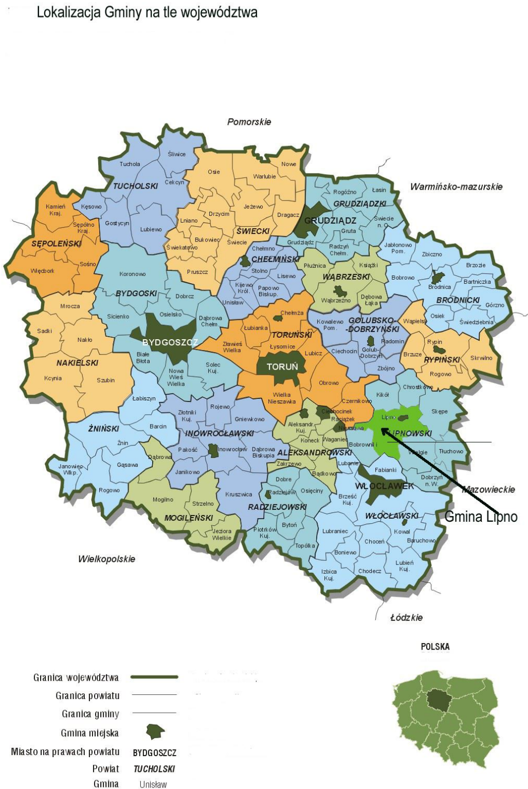
Rysunek 1. Lokalizacja Gminy Lipno na tle województwa kujawsko-pomorskiego